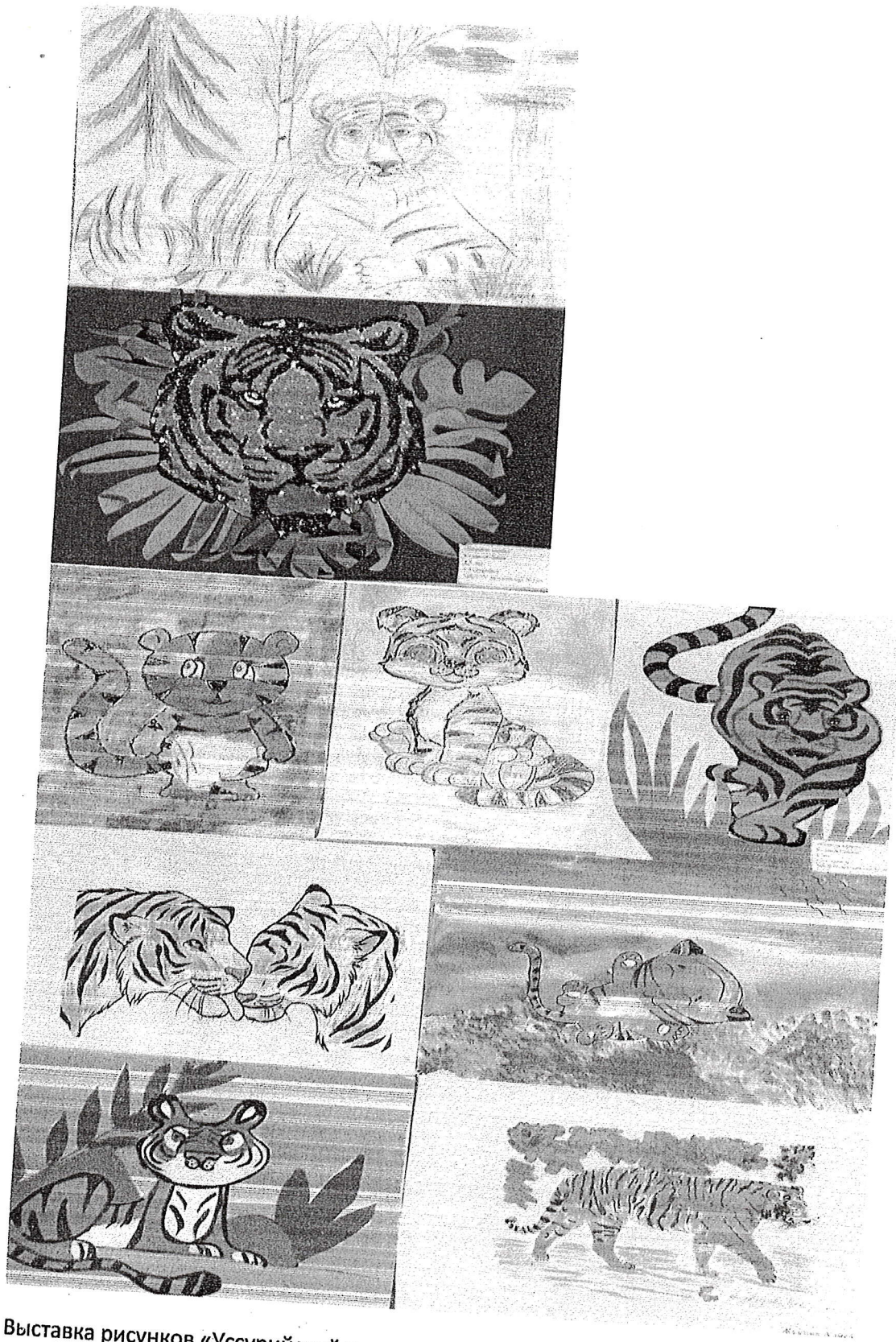
Выставка рисунков «Уссурийский тигр»